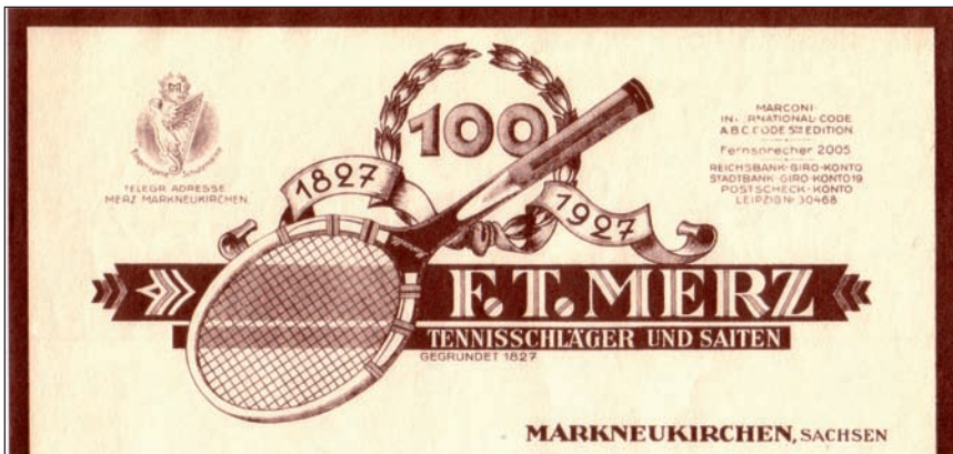
Briefkopf aus dem Jahr 1927.

Aus dem am 20. September 1934 angeordneten Verfahren der Zwangsversteigerung heraus wurde die Villa am 31. Januar 1935 an Dr. med. Gerhard Schmidt verkauft. Der Kaufpreis von 35.000 RM ging ausschließlich an die Banken, um die für Curt Merz bestehenden Hypotheken abzulösen. Gleichzeitig wurde ein Teil des Grundstücks Nr. 1203 als künftiges Flurstück 1203 b abgetrennt und von der Stadtbank für 8.000 RM übernommen. Somit konnte am 2. März 1935 die beantragte Zwangsvollstreckung zurückgenommen werden. Die weitere Geschichte vom Wohnhaus eines Arztes (mit Praxis im Kellergeschoss) über den Städtischen Kindergarten bis hin zum Sitz einer Fachschule für Instrumentenbau (1988), die 1992 zum heutigen Studiengang wurde, sei hier nur noch angedeutet.