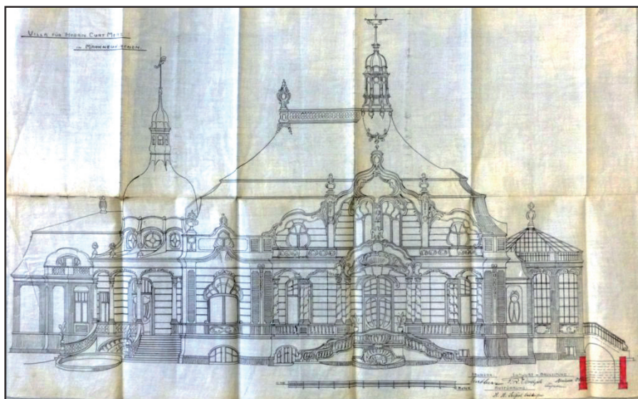
Außenansicht von Süden in den Bauakten der Villa Merz

Bruttolohn, der nach heutiger Kaufkraft 590 €entsprüche [so war das im Sommer dieses Jahres in einer Dokumentation im Museum Peenemünde zu lesen]. Einfache Einfamilienhäuser hat man um 1900 noch für vierstellige Beträge errichtet, 1929 kalkulierte man ein Handwerkerhaus in Markneukirchen mit zwei Dreiraumwohnungen z. B. für 16.400 RM.)