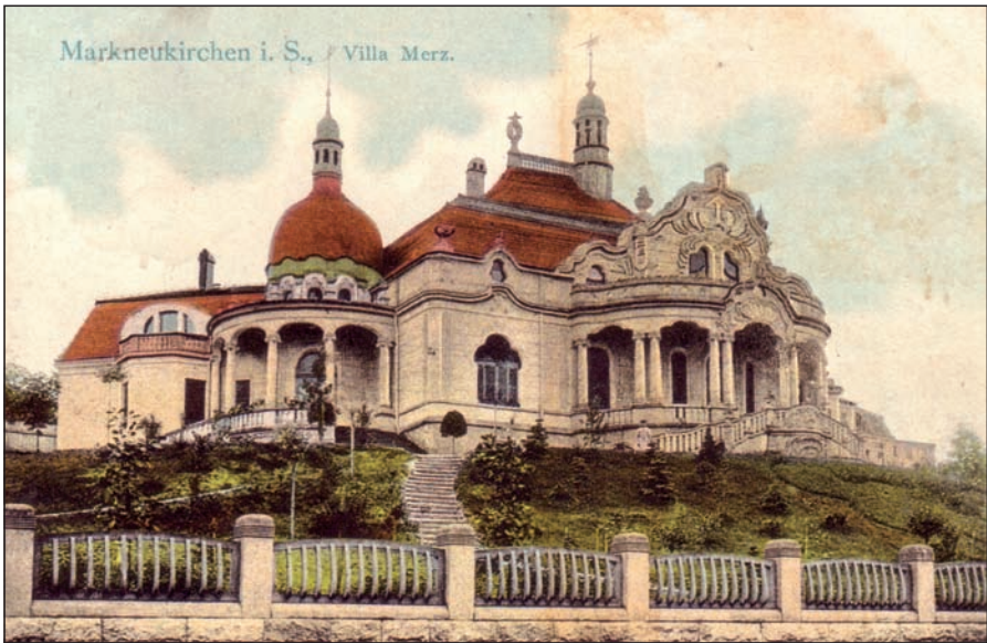
Ansichtskarte der Villa Merz (1909, handkoloriert)

Seit 25 Jahren gibt es in Markneukirchen den Studiengang Musikinstrumentenbau. Sein Domizil ist die Villa Merz in der Adorfer Straße. Dort sind Werkstätten und Seminarräume untergebracht, finden bemerkenswerte Tagungen und regelmäßige Konzertveranstaltungen statt. Das Jugendstilgebäude beeindruckt Einheimische und Gäste gleichermaßen. Fragen zur Geschichte werden gestellt, zu denen es im Jubiläumsjahr des Studiengangs neue Antworten bzw. weitere interessante Fakten gab. Zunächst die Feststellung: Auch die Villa hatte einen runden Geburtstag. Fertiggestellt im Sommer 1903, konnte sie selbst das 110. Jubiläum begehen.