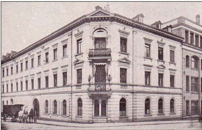
Wohn- und Geschäftshaus der Familie Reinhold in Meerane, rechts angrenzend die Fabrik