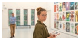
Kunstmuseum Dieselloch Cottbus