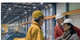
Kraftwerk Schwarze Pumpe