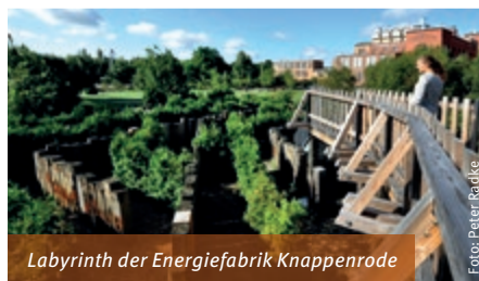
Labyrinth der Energiefabrik Knappenrode

Vor 17 Millionen Jahren begann der Entstehungsprozess der Braunkohle. Im Zeitalter des Tertiärs war das Klima in der Lausitz noch subtropisch. Statt Kiefern wuchsen hier Mammutbäume und es reihte sich Moor an Moor.