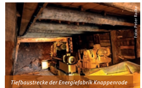
Tiefbaustrecke der Energiefabrik Knappenrode

Ein solcher 3 Förderturm mitsamt Tiefbaustrecke ist der nächste Erlebnisort. Mit Betreten der Tiefbaustrecke bekommt man schnell einen Eindruck von den harten Bedingungen und der Gefahr der Arbeit unter Tage. Dunkel, kalt und nass war es hier, wenn sich die Kumpel in dem engen Stollen mit ihren Arbeitsgeräten und kleinen Grubenloks bewegten. Verlässt man den Stollen wieder, ragt darüber der Förderturm, der einstige Eingang zum Entwässerungssystem und zu den Kohleflößen. Mit zwei Aufzügen fuhren die Kumpel und die Kohle auf und ab.